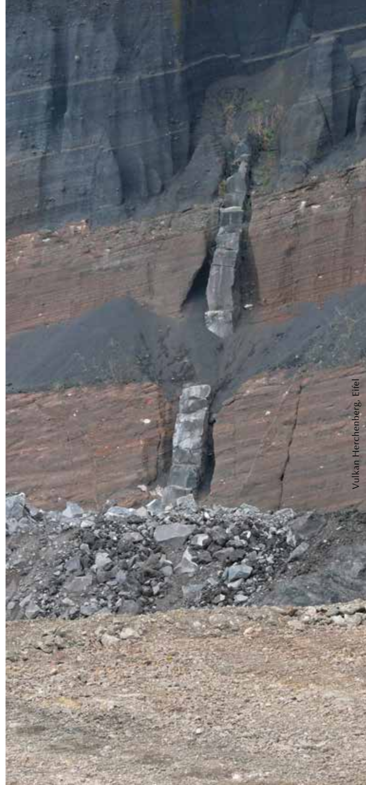
Vulkan Herchenberg, Eifel