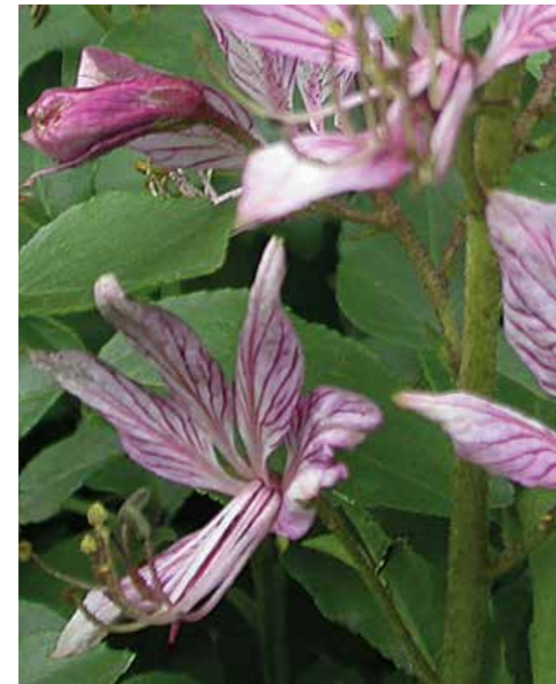
Diptam ( Dictamnus albus )